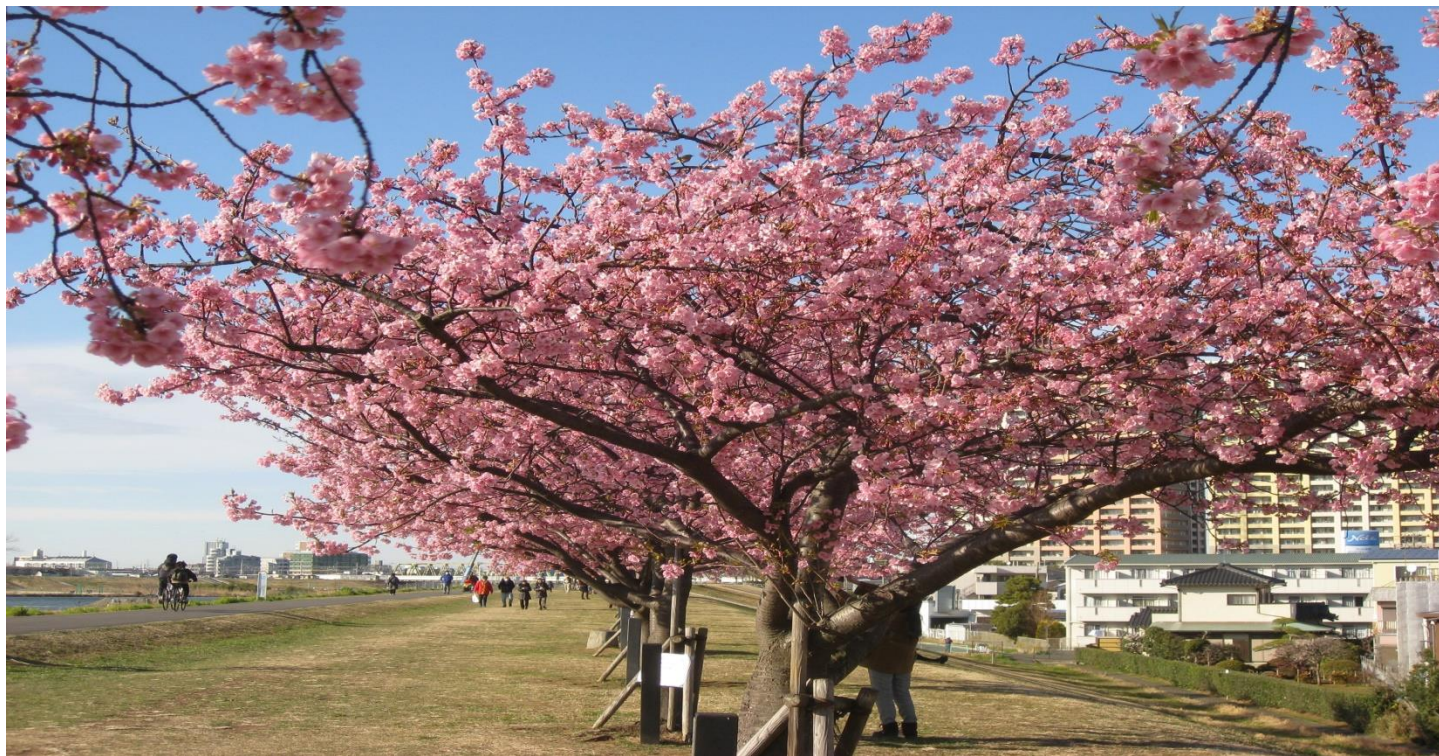
江戸川沿いの河津桜