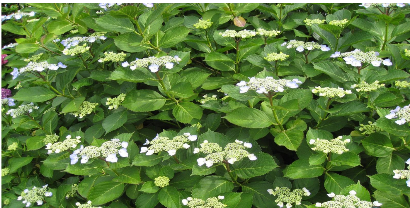
公園に咲く紫陽花